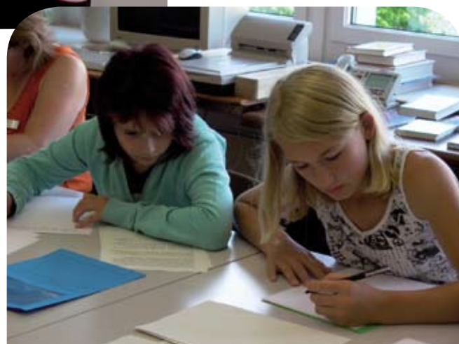
Buchwerkstatt in der Landesbibliothek.