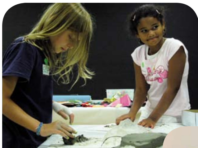
Auf Entdeckungs- und "Ausprobierreise" im Kunstmuseum Liechtenstein.