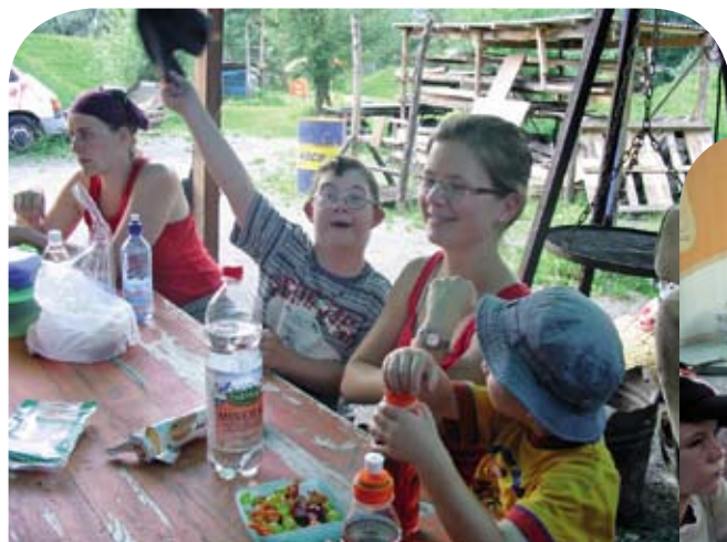
"An Tag uf em Dräggsplatz" mit dem aha.