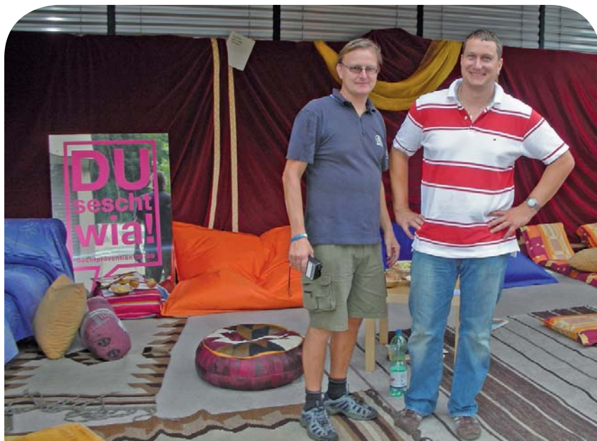
Chillout-Zone am Staatsfeiertag Vaduz: Alkoholfreie Cocktails von Jugendreferat und Camäleon Vaduz in Kombination mit Alkoholtester in der Chill-Zone.

Das NetzWerk, Verein für Gesundheitsförderung Triesen (Landstrasse, direkt neben der Post) bietet Rauchstoppkurse an. In fünf bis sechs Abenden (zu je zwei Stunden) gibt es Unterstützung wenn du das Rauchen aufgeben oder zumindest reduzieren möchtest. Dieses Vorhaben in einer Gruppe umzusetzen, sich regelmässig zu treffen und auszutauschen, lässt das gesteckte Ziel realistischer werden. Eltern oder Lehrperson einer beim TABAKfrei-Wettbewerb teilnehmenden Klasse können den Kurs kostenlos absolvieren! Ebenfalls sechs Jugendliche, die sich umgehend bei info@flash.li melden. Information und Anmeldung bei NetzWerk, Tel. (00423) 399 20 82, email netz@netzwerk.li . Den Rauchstoppkurs gibt es laufend bei genügend Anmeldungen.