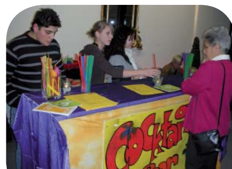
Die Offene Jugendarbeit Schaan, das Popcorn offeriert alkoholfreie Cocktails: Let's have a party!

Alle Klassen, welche mit Erfolg TABAKfrei geblieben sind, erhalten je TeilnehmerIn einen Anerkennungspreis von CHF 20.-, mindestens jedoch CHF 200.— pro Klasse. Darüber hinaus nehmen diese Klassen an einer Auslosung teil. Die Hauptgewinnerklassen erhalten total einen Betrag zwischen CHF 700.- und CHF 1'000.-. Die Preisgelder sollen von den Klassen für etwas Gemeinsames eingesetzt werden.